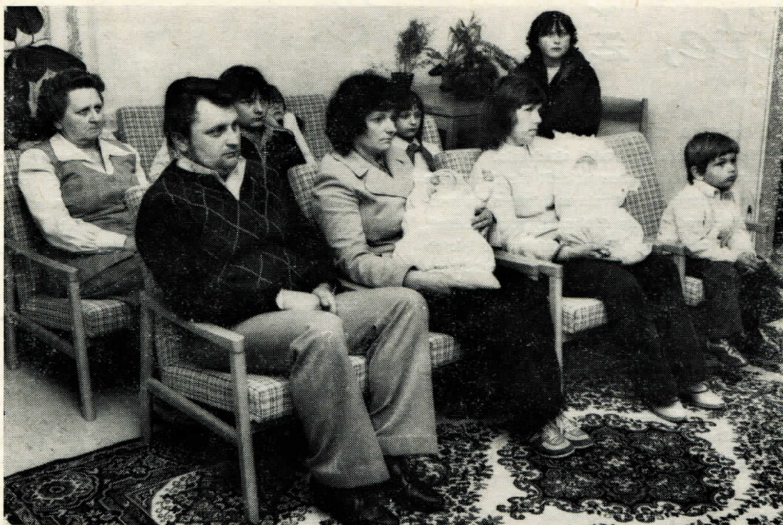
Z posledního vítání občánků